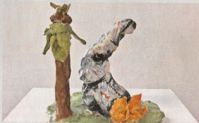
■ Pieza de la artista que expone en el sitio independiente Interior 2.1.

“Había estado trabajando mucho con el performance, el video y las acciones en vivo y por otra parte con la ilustración, el cómic y el di-